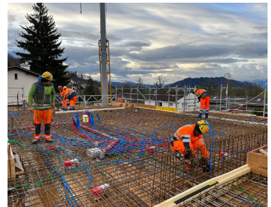
Beispiel: Baumeisterarbeit, Einlagen und Bewehrung