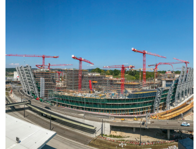
Beispiel: Grossbaustelle Zürich, „Circle“

Wir wünschen Ihnen viel Erfolg! Februar 2026, die Kurskommission