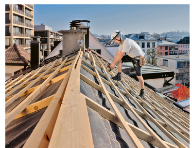
Beispiel: Zimmermannsarbeit, Montage Ziegellattung