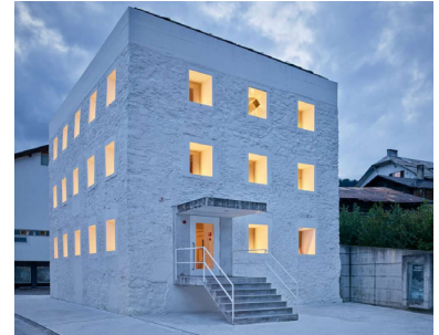
Das gelbe Haus, Flims Valerio Olgiati

Wir wünschen Ihnen viel Erfolg! November 2025, die Kurskommission