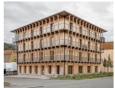
Bürogebäude Küng Holzbau, Sarnen - SeilerLinhart