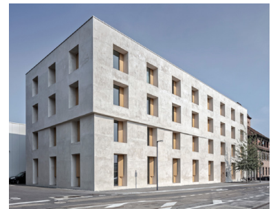
Bürogebäude Emmenweid Baumschlager Eberle