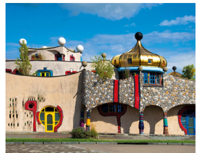
Markthalle Altenrhein, Friedensreich Hundertwasser