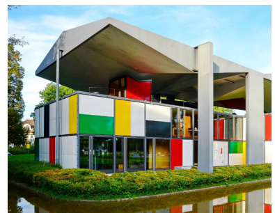
Pavillon le Corbusier, Le Corbusier