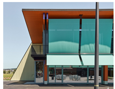
Schulhaus Chliriet, BS+EMI Architekten