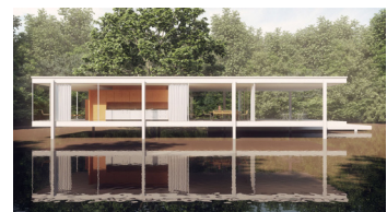
Farnsworth House, Mies van der Rohe