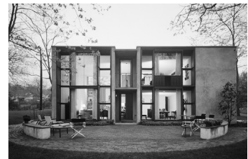
Esherick House, Louis Kahn